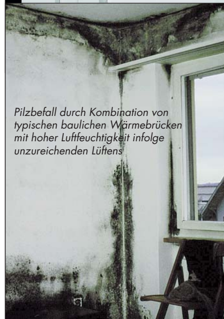
Pilzbefall durch Kombination von typischen baulichen Wärmebrücken mit hoher Luftfeuchtigkeit infolge unzureichenden Lüftens