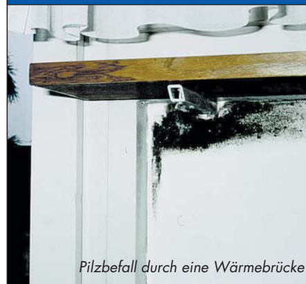
Pilzbefall durch eine Wärmebrücke