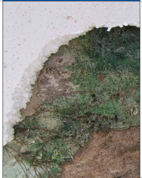
Abb 3: Algenbefall unter der Dämmung aus Styropor

Ermittlung der Kennwerte: es handelt sich neben der Rohdichte der Baustoffe um thermische und hygrische Kennwerte, die größtenteils durch Messungen ermittelt wurden. Für einige Baustoffe wurden die Kennwerte aus der Literatur übernommen.