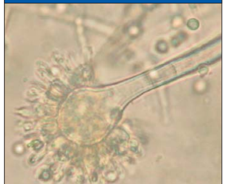
Abb 4: Mikroskopische Aufnahme eines typischen Innenraumpilzes Cladosporium cladosporioides

DIN- bzw. EN-Normen zu verankern. Abbildung 5 zeigt den schematischen Aufbau einer an der Uni Dresden entwickelten Messeinrichtung. Diese ermöglicht es, den Trocknungsverlauf unter konstanten Randbedingungen zu bestimmen.